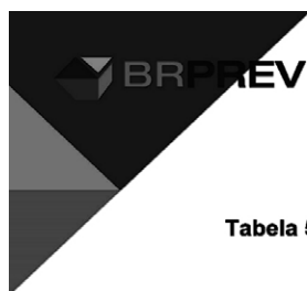
Tabela 54 – Projeção das Receitas e Despesas